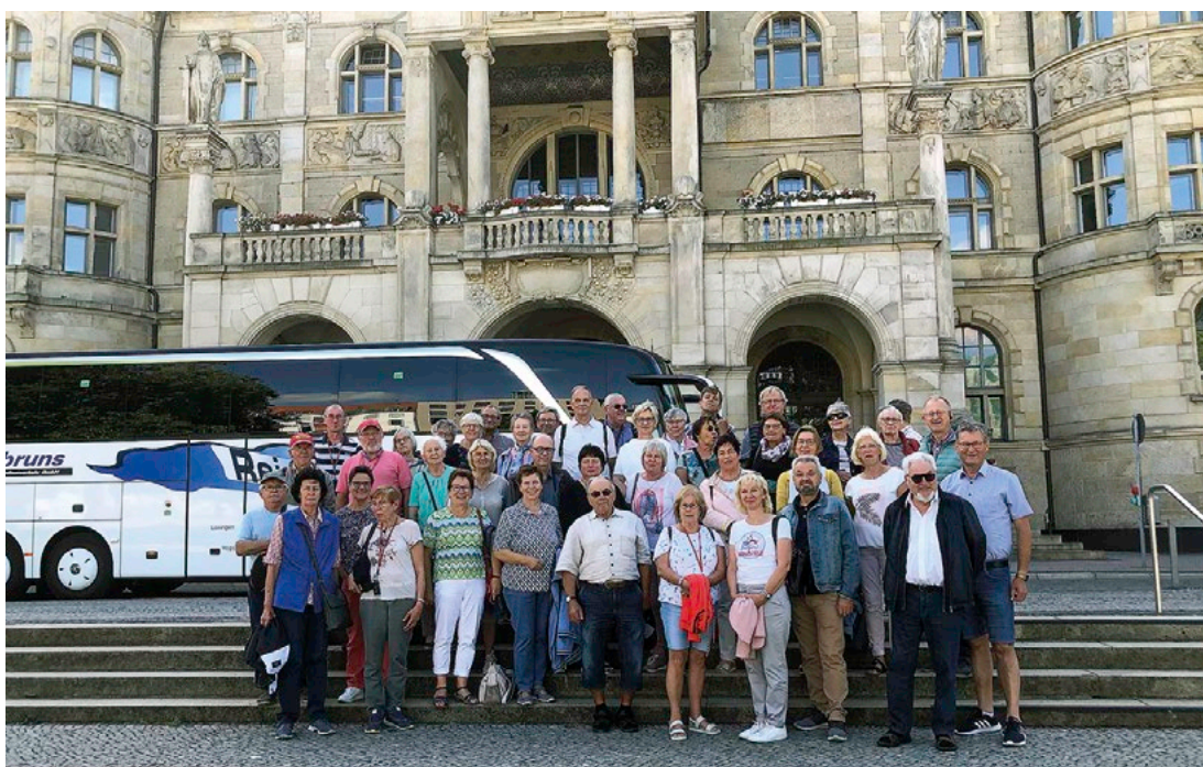
Die Landeshauptstadt Hannover war eines der Ziele der Viertagefahrt des Heimat- und Verkehrsvereins Ankum.

Im kommenden Jahr wird es eine Sechstagesfahrt ins Allgäu geben, und zwar vom 22. bis 27. August 2023.