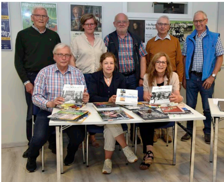
Das Lohner Industriemuseum eröffnet am 14. Oktober 2022 eine neue Ausstellung über Lohne und die Region in den 1950er und 1960er Jahren. Dazu hat eine Vorbereitungsgruppe einen umfangreichen Begleitband erarbeitet.

Für die jüngeren Generationen, die mit den Fragestellungen und Gewohnheiten der heutigen Zeit in die Ausstellung gehen oder den Begleitband studieren, könnte die Begegnung mit dieser Zeit-epoche „ein Buch mit sieben Siegeln“ bedeuten. Dieses „Buch“ muss aber nicht verschlossen bleiben. So sind z. B. ein Telefongerät mit Wählscheibe, eine Milchkanne oder das magische Auge eines Radiogeräts für viele Jüngere mit Rätseln verbunden. Die intellektuelle Neugier für die Lebenswelt der Eltern und Großeltern sollten der Begleitband und die Ausstellung wecken und die Jüngeren zu einem spannenden Dialog mit der Vergangenheit anregen und das Hineinversetzen in „die Zeiten der Vergangenheit“ ermöglichen.