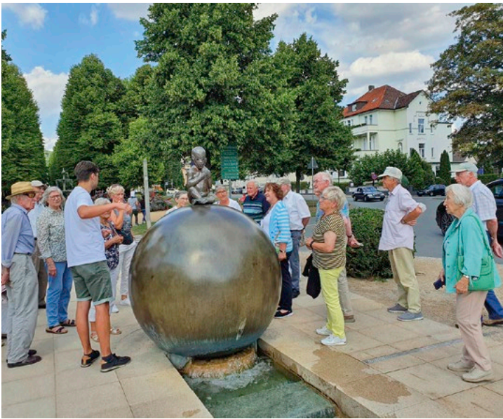
Auf der Studienfahrt des Kreisheimatbundes Bersenbrück (KHBB) wurde unter Führung auch das Staatsbad Pymont besichtigt.