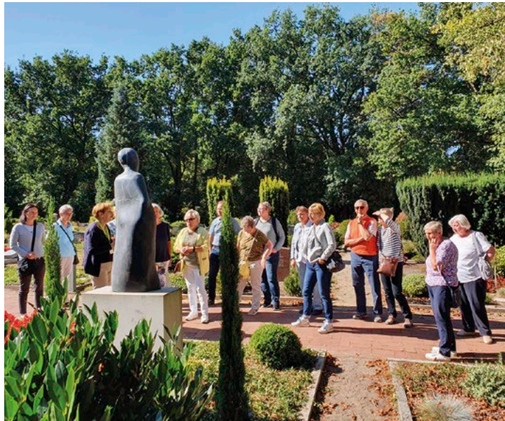
In drei Gruppen erkundeten die Teilnehmer der Tagesfahrt des Heimatvereins Bersenbrück unter Führung das Künstlerdorf Worpswede, hier auf dem Friedhof des Orts, wo Künstlerinnen und Künstler bestattet sind.

Der Bus startete ab Bahnhof Bersenbrück. Die Fahrt führte zunächst nach Dötlingen. Auf Gut Altona wurde ein reichhaltiges Frühstück angeboten. Anschließend ging es weiter zum Künstlerdorf Worpswede. Hier wurden im Rahmen einer Führung die Werkstätten berühmter Künstlerinnen und Künstler besichtigt. Im Anschluss wurde hier auch das Mittagessen eingenommen. Danach ging die Fahrt weiter zur Residenzstadt der Großherzoglichen Grafen nach Oldenburg, die bei einer Stadtrundfahrt kennengelernt wurde. Anschließend klang der Tag bei Kaffee und Kuchen aus.