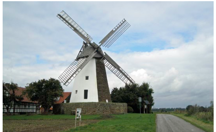
Windmühle Eickborst am Arminiusweg