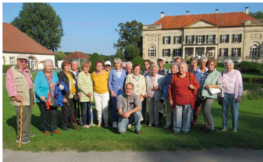
Der Verschönerungsverein von 1870, Heimatverein Georgsmarienhütte e.V., besuchte die Schlossanlage Harkotten bei Füchtorf – Gruppenaufnahme vor dem Herrenhaus von Korff.

Nach der circa einstündigen Führung gab es Kaffee und Kuchen in der Rentei mit Café im Wappensaal. Es war ein rundum gelungener Ausflug.