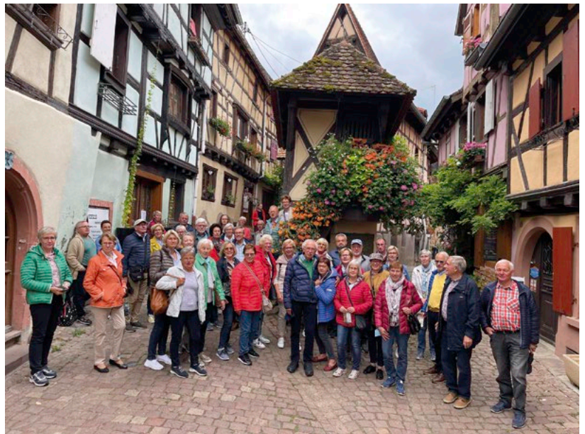
Reisegruppe in Eguisheim im Herzen des schönen Elsass

Die besondere Lage, nämlich 755 Meter hoch auf dem Bergkamm, hatte eine strategisch wichtige Bedeutung für die Verteidigung. Beim Rundgang durch die Burg erlebten die Mitglieder des Heimatvereins die mittelalterliche Geschichte hautnah. Mit vielen wunderschönen Eindrücken und Erinnerungen wurde schließlich die Heimreise angetreten. „Das war ein toller Ausflug“, sprach eine Mitreisende aus, was die ganze Gruppe fand.