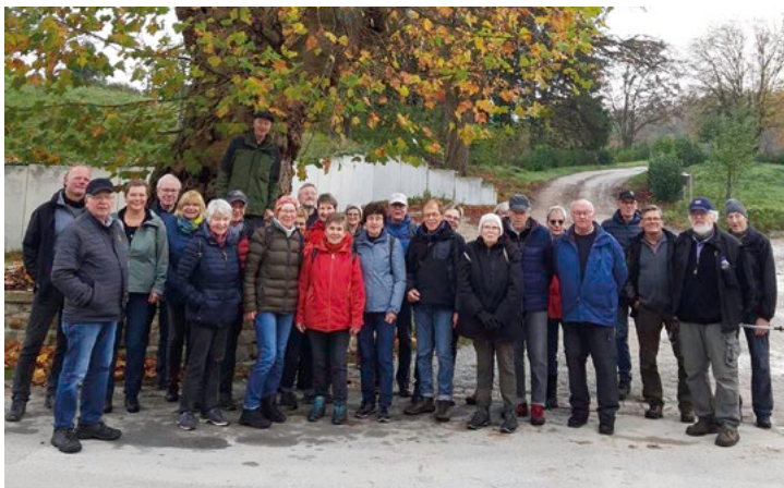
Wandergruppe auf dem Gelände der einstigen Flachsspinnerei Uffmann

Grenzsteine, wo auf einer Seite ein „H“ für Hannover mit der Jahreszahl 1837 und der anderen Seite ein „P“ für Preußen mit fortlaufenden Nummern eingemeißelt sind. Wegen des doch sehr nassen Waldbodens konnte ein noch älterer Grenzstein mit den Sparren der Grafschaft Ravensberg und der Jahreszahl 1783 leider nicht besichtigt werden. Nach circa zwei Stunden kehrte die Wandergruppe zum traditionellen Grünkohlessen in das Lokal Zurmühlen in Borgholzhausen ein.