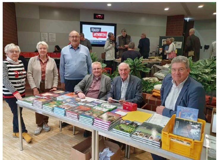
Der Kreisheimatbund Bersenbrück auf der 21. Bücherbörse bot im Kreishaus-Restaurant in Osnabrück auch eigene Literatur an.

Außerdem stellte er das Heimatjahrbuch 2024 der beiden Heimatbünde vor, das sich schwerpunktmäßig mit der Heimatforschung und -pflege beschäftigte und einen Querschnitt durch die einzelnen Bereiche der Heimatpflege bilde. Das Heimatjahrbuch kann bei den Heimatbünden und in den Buchhandlungen zum Preis von 14,90 Euro erworben werden.