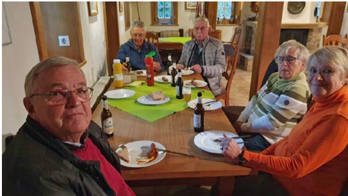
Zum Ausklang der diesjährigen Wandersaison traf man sich in gemütlicher Runde im Heimathaus Feldmühle.

haus Feldmühle. Man radelte durch die herbstlich bunte Landschaft und genoss noch einmal die frische Luft. Anschließend wurde am Heimathaus gegrillt, wozu auch die Nichtwanderer eingeladen waren. In gemütlicher Runde ließ man die vergangene Wandersaison Revue passieren. Im kommenden Jahr werden wieder neue Fuß- und Radwanderungen angeboten, beginnend am 14. Januar mit einer Winterwanderung.